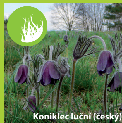
Koniklec luční (český)